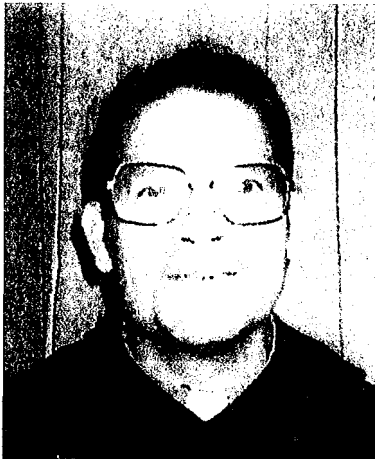
En los últimos años