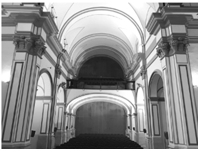
Figura 2. El interior de la iglesia vista desde el presbiterio. Se aprecia el sistema de ordenación clasicista de los muros, la depuración ornamental de los alzados y vueltas. Elaboración propia.