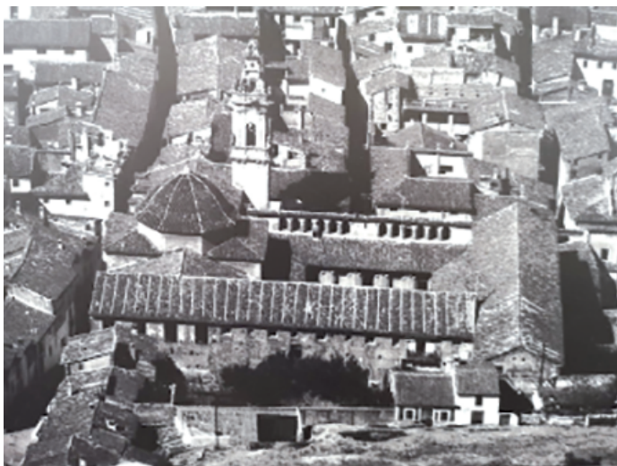
Figura 1. Vista del convento agustino de San Sebastián (Xàtiva) desde la parte alta de la ciudad, a principios del siglo XX. Se advierte el buque de la iglesia y las distintas dependencias conventuales, destinadas a distintos usos, alrededor del claustro.