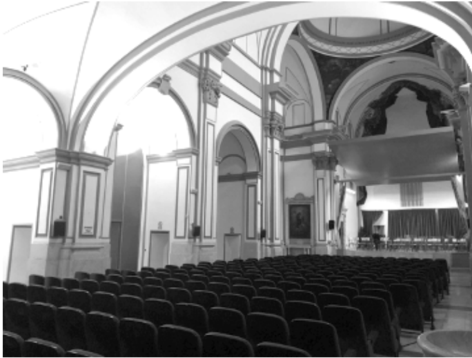
Figura 3. El interior de la iglesia desde el acceso principal, bajo el coro. A pesar de las butacas y otros añadidos (el templo se usa como auditorio) se advierte el crucero y el espacio del presbiterio. Elaboración propia.